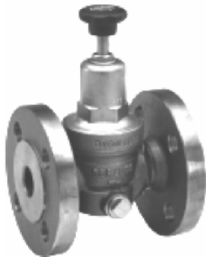
DN 15 bis DN 32