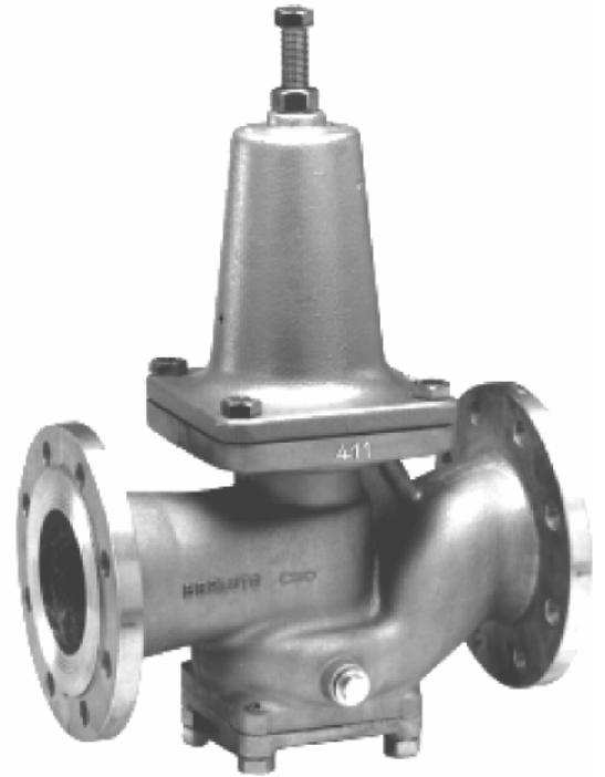
DN 80 bis DN 125